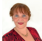
Elvira Böck Organisation