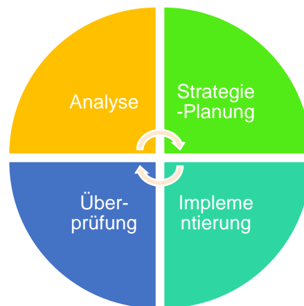
Figur 2. Iterativer Prozess zur Umsetzung der Gleichstellungsmaßnahmen im Verein Lebensmittelversuchsanstalt 2 .

Implementierung = Umsetzung in Maßnahmen Überprüfung = jährliches Monitoring und Evaluierung